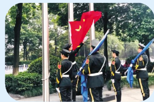
7月15日的早晨,下着蒙蒙细雨,固定日升旗仪式在集团总部广场,如期举行。