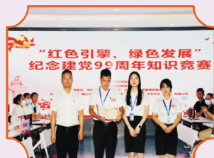
最佳金点子： 中宙物业·商业——冲锋队