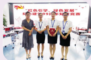
一等奖：中宙物业——不忘初心队

赛场上，选手们个个精神饱满、沉着应对，展现出扎实的政治理论功底。必答题环节，9支代表队你追我赶、不甘落后，比分紧咬；抢答题环节扣人心弦，有的“抢”得神速，有的“答”得精准，大家都铆足了劲，一度将现场氛围推向高潮，赢得观众阵阵掌声。风险题环节，各队斗智斗勇，采用不同“战术”，力求稳妥。在金点子题环节，各队为集团发展的重点、难点出谋划策，展现了每个队伍的独特风采。此次比赛，还加入了观众互动环节，大家也是积极参与答题，气氛轻松而热烈。整场比赛高潮迭起，精彩纷呈，经过激烈的角逐，最终决出了一、二、三等奖，以及最佳金点子团队。