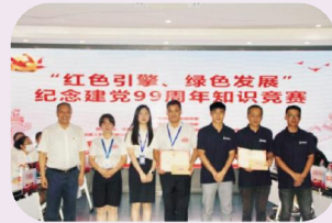
二等奖：中宙物业·商业——冲锋队 中宙建工——山外有“三”队