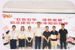
三等奖：中宙控股——不掉队 中宙投资——祖国花朵三缺一队