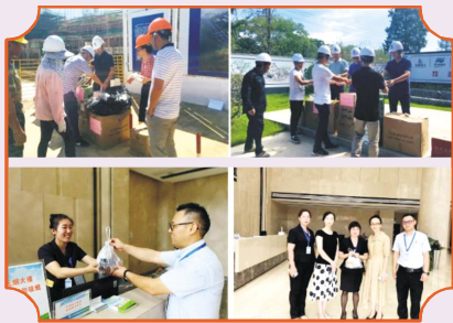
给员工送去丝丝清凉。

同时,集团工会也在中宙物业各管理处开展了“炎炎夏日送清凉 滴滴关怀暖人心”的主题活动,为奋战在高温一线的员工开展现场慰问,为员工送上解暑降温物资,