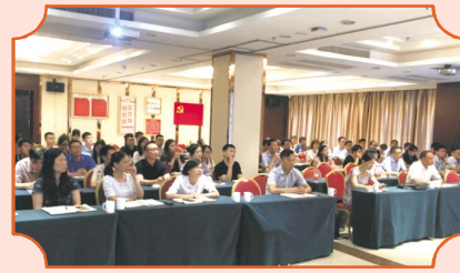
浙江大学管理学院教授、浙江众成咨

8月2日下午，集团在一楼会议中心举办了“绩效考核、薪酬管理”宣贯学习会。集团董事会、总裁班子、职能部门全体人员及各子公司管理层共70人参加了本次学习会。