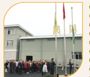
志,推动公司的持续前进和健康发展。(澜海生态农业 程洁)

面前。在这样良好的工作环境中,我们更要振奋精神,将更大的精力投入到日常生产中。员工要争当先进,班组长要做好表率作用,党员干部更要起到模范带头作用。 澜海生态农业正处在发展的新时期,面临着新形式、新任务和新挑战,全体员工要在十九大精神的指引下,用我们勤劳智慧的双手和钢铁般的意志,推动公司的持续前进和健康发展。 (澜海生态农业 程洁)