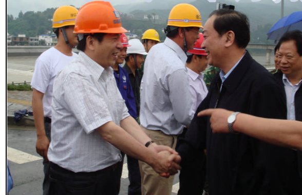
▲6月9日,中共浙江省委常委、杭州市委书记黄坤明(右二)率杭州市党政代表团慰问我公司青川援建项目部。

2009年12月,我公司承接了新建四川省青川县消防中队用房和竹园新区医院的施工任务,这是我公司继2008年7月完成援建四川