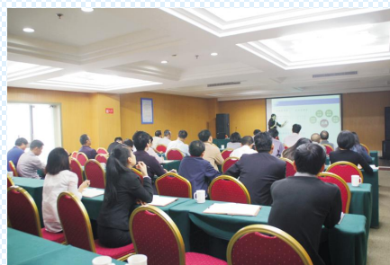
主编:鲁红梅 审核:吴知明