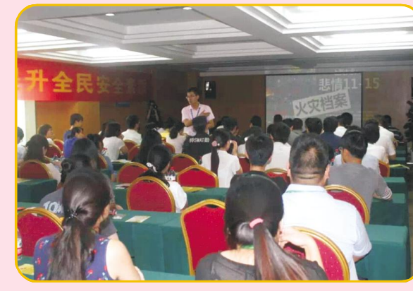
(上接第二版) 合同管理。

安全生产月活动虽然结束了,但安全生产是一项必须长期坚持的工作,中宙物业将持续向员工灌输安全工作重要性的认识,持续完善安全管理机制,持续为业主提供安全的工作生活环境。