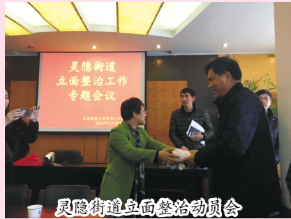
灵隐街道立面整治动员会