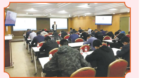
中宙建工质量安全部《安全生产法》考试第一名