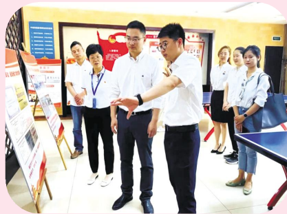
青年建功、青年阵地打造激发青年活力、青

年服务创新增强青年归属等方面的内容表示了肯定,并希望中宙团组织能够通过“青字号”品牌的打造,继续发挥好团组织的作用,带领团员青年建功立业,与行业内乃至行业外的其他团组织做好联动,共同助推非公企业健康发展。