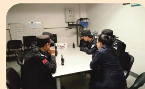
莲花商务中心管理处收看十九大开幕会(3)