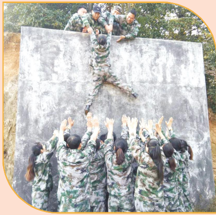
效,充实、提升员工们的获得感、幸福感,万众一心推动中宙物业蓬勃发展! (物业办 叶冬凤)

希望活动后,管理团队能将拓展训练的收获应用到实际工作中去,要率先垂范、坚守底线,突出重点,完善规矩,竭尽全力办好一件一件事情,带领、激励团队成员提质增效