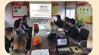
公交闸口项目部收看十九大开幕会