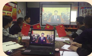
双桥项目收看十九大开幕会

集团对收听收看十九大开幕会高度重视,要求各公司把收听收看十九大召开盛况作为一项重要的政治任务,周密安排,认真落实,保证广大员工及时深入学习领会十九大精神。对于确实没有条件组织收看直播的职工,党委及时将十九大报告的内容及重点摘要推送到每位员工的钉钉平台,方便大家自行通过电脑、手机等方式,及时了解十九大动态,自觉学习习总书记等重要讲话精神。(下转第四版)