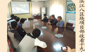
滨江八区项目部收看十九大开幕会