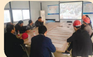
紫荆花幼儿园收看十九大开幕会