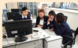
莲花商务中心管理处收看十九大开幕会(2)