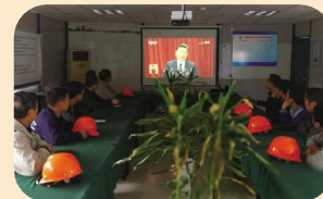
古荡三期项目部收看十九大开幕会