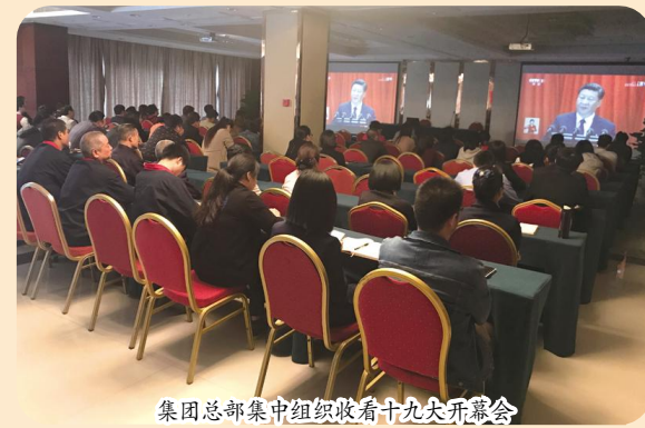
集团总部集中组织收看十九大开幕会

2017年10月18日上午9时,举世瞩目的中国共产党第十九次全国代表大会胜利召开,中宙控股集团组织总部、各公司、各项目部、各管理处的党员、干部、员工、农民工等收看了党的十九大开幕会,认真聆听习近平总书记所作的十九大报告。习总书记讲话坚定自信、铿锵有力、催人奋进。党的十九大报告,犹如一面旗帜、一把火炬、一声号角。