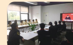
蒋村商务中心管理处收看十九大开幕会