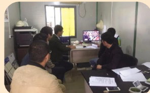
大小龙驹项目部收看十九大开幕会