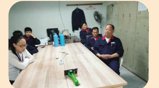
莲花商务中心管理处收看十九大开幕会(1)