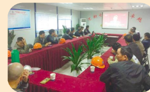
蒋村中小学项目部收看十九大开幕会