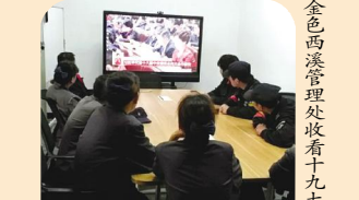
金色西溪管理处收看十九大开幕会