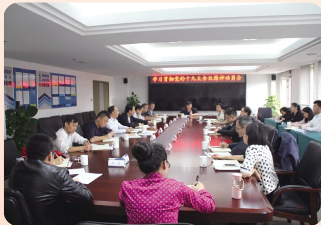
学习贯彻党的十九大精神动员会

干部要自觉学、认真学,深入学,要与各自的岗位和工作结合学,明方向,明目标,明责任,全面做强做实中宙控股党建工作。工、青、妇组织要发挥各自的组织优势,以各自的智慧和魄力,发动、带领全体员工、广大青年、妇女同志,积极参与,敢于争先,善作善成,激发集团全体员工胸怀祖国、胸怀大志,继续发扬艰苦奋斗、创业创新的满腔热情,开创一片蓝海,以好的民风、家风、社风撑起好的党风、政风。企业行政工作,要坚定目标,找准结合点,借力发力,努力开拓创新,形成乘势而上、乘风破浪的局面。中宙控股经理班子、部门负责人同志,一定要找准学习党的十九大精神与完成年度目标、做好2018年工作计划的结合点;要想清楚、不懈怠,有魄力、有