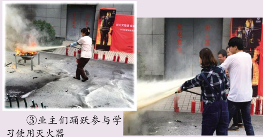
③业主们踊跃参与学习使用灭火器

演习结束,物业管理服务中心根据演习情况,认真总结,找出差距,并制定出相应的整改措施,保证园区人身和财产安全,确保全年无事故,警惕每一天。