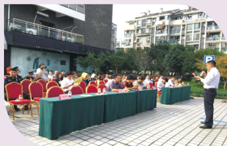
①消防火灾现状情况讲解