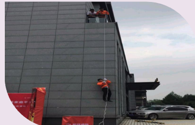
④逃生速降演习讲解