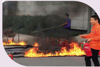
②灭火基本知识讲解示范